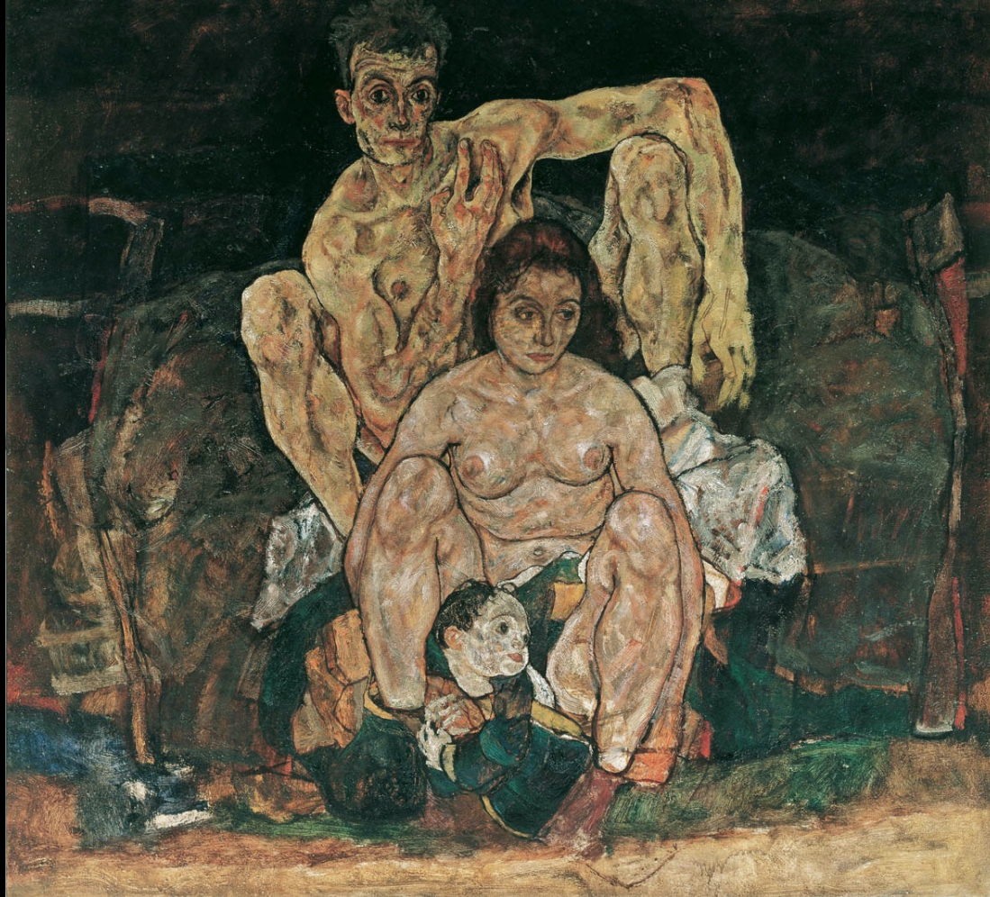
CARTA NUMERO 4 SESSO